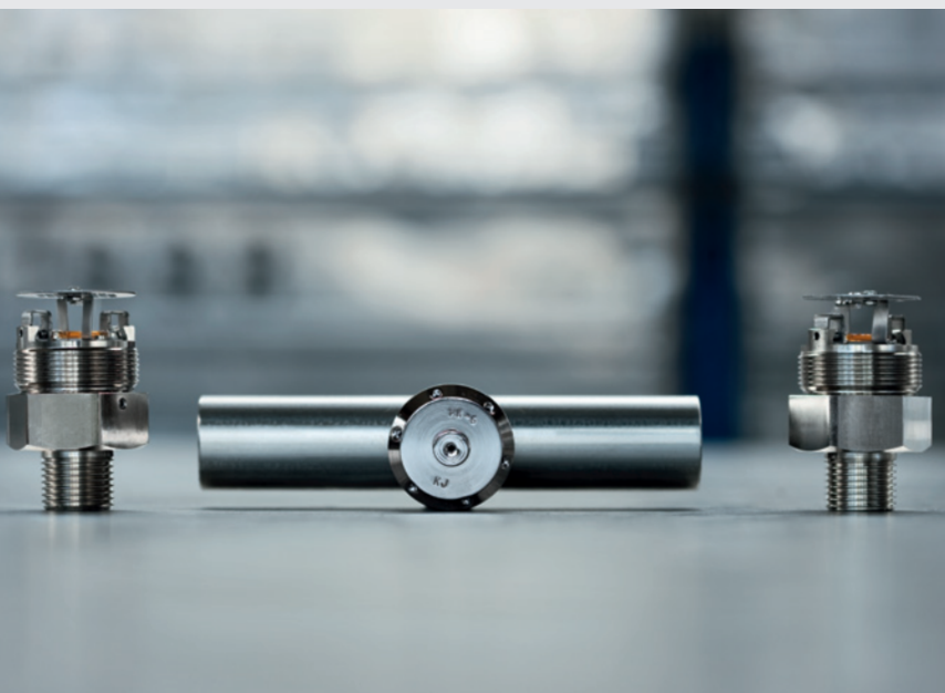
СРАВНЕНИЕ СИСТЕМЫ ОГНЕТУШЕНИЯ С ИСПОЛЬЗОВАНИЕМ ТОНКОРАСПЫЛЕННОЙ ВОДЫ И СТАНДАРТНОЙ СПРИНКЛЕРНОЙ СИСТЕМЫ